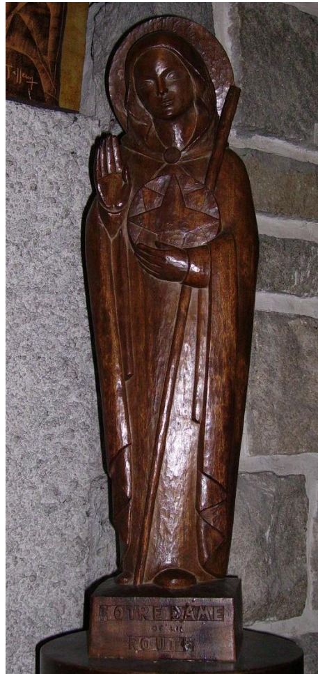
Notre Dame de la Route (1962, à Chamalières, Puy-de-Dôme),

Ces deux événements majeurs de Lourdes et Vézelay 1978 se calquaient, sans corrélation voulue mais les coïncidences marquèrent plus d'un témoin, sur ceux de la grande Église en cette année des trois papes : la mort de saint Paul VI, apprise sur le chemin vers Lourdes, et surtout l'élection du grand pape polonais (juste avant Vézelay) ouvrant une nouvelle page ecclésiale et mondiale qui allait marquer une génération d'hommes.