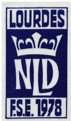
Insigne du pèlerinage international de Lourdes, 1978

Tout d'abord ce fut en août le grand pèlerinage international des chefs et cheftaines du mouvement de Saint-Bertrand de Comminges à Lourdes (tronçon de la Route Saint-Jacques créée deux ans plus tôt), marqué par le jeu scénique « Comme l'aurore » d'Henri Gire joué à Garaison. C'est devant la grotte de Massabielle, le 13 août, que le mouvement se consacra à l'Immaculée (voir le texte dans Maîtrises n° 44, nov. 1978, p. 7) et que fut poussé pour la première fois l' Ad Mariam Europa ! , promu cri fédéral.