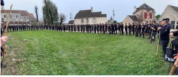
Rencontre des RS en chapitre dans le cloître de la basilique de Vézelay avant la messe d'envoi